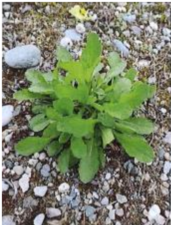
Berufkraut im blütenlosen Zustand