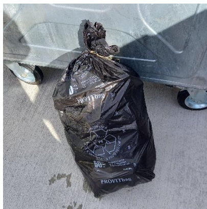
Kein offizieller Müve-Kehrichtsack und ohne Vignette

In der letzten Zeit wurde festgestellt, dass bei der Abfallsammelstelle beim Parkplatz des Gemeindehauses, verschiedene Abfälle nicht korrekt entsorgt wurden. Nachfolgend einige bedenkliche Aufnahmen: