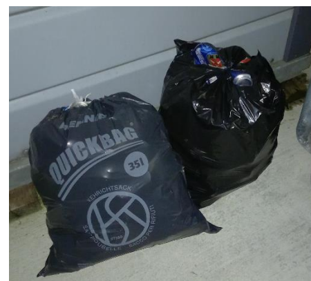
2 Kehrichtsäcke voller Dosen

Es ist nicht die Aufgabe der Gemeindemitarbeitenden, den Abfall von Privaten fachgerecht und vor allem auf Kosten der Gemeinde zu entsorgen. Das ist unfair und unsozial! Wir machen Sie darauf aufmerksam, dass die Abfallsäcke auf Hinweise durchsucht werden. Wir rufen die Bevölkerung dazu auf, uns gemachte Beobachtungen zu melden. Wir sind bestrebt, die Abfallsünder ausfindig zu machen.